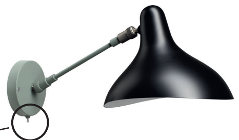
BS5 SW GR-BL

Black mat | Satin nickel Noir mat | Nickel satin