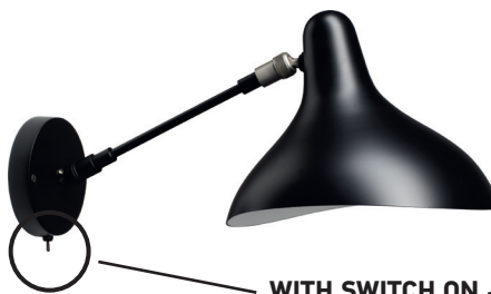
BS5 SW BL

Green mat | Black satin | Satin nickel Vert mat | Noir mat | Nickel satin